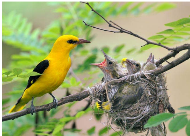
Pirolmännchen beim Füttern im Blätterdach

Wer seine flötenartigen Ruf einmal gehört hat, vergisst ihn nicht mehr und wer den farbenprächtigen Vogel einmal gesehen hat, sowieso nicht. Der Pirol ist vom Schweizerischen Vogelschutz (SVS) zum Vogel des Jahres erkoren worden. Vögel, die diesen Titel erhalten, haben normalerweise einen leider traurigen Status. Ihre Bestände sind in den vergangenen Jahren meist so stark zurückgegangen, dass sie es in die Rote Liste geschafft haben. So auch der Pirol.