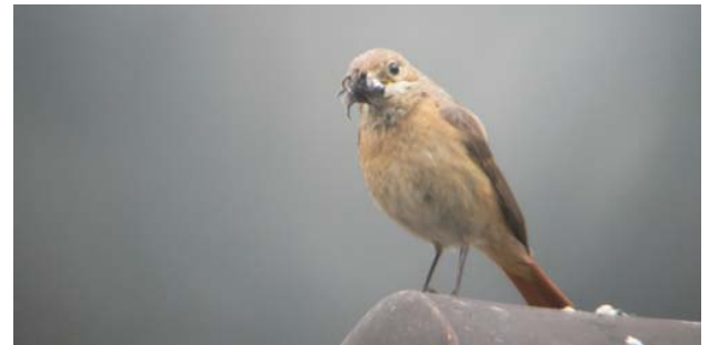
Sarganserländer Gartenrotschwanzweibchen mit „Spinnen“-Futter für die Jungen

Im letzten Newsletter haben wir über fünf vielversprechende Beobachtungen des Gartenrotschwanzes berichtet. Beobachtungen von zusätzlichen Individuen sind nicht mehr bekannt geworden. Erfreulich ist die Tatsache, dass es zumindest bei drei der Beobachtungen zu Bruten gekommen ist bzw. sein könnte.