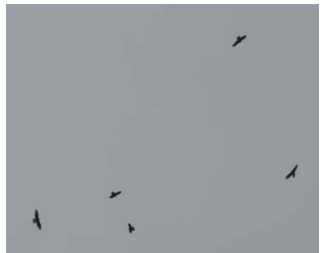
Ziehende Wespenbussarde anfangs September 2012 beim Schollberg

Die Auswertungen der erfassten Daten deuten darauf hin, dass die Saarebene bei Sargans im Herbst neben tausenden Singvögeln auch von den Thermikfliegern unter den Vögeln überflogen wird. Zu ihnen gehören verschiedene Greifvögel wie der Wespenbussard, die Rohrweihe und manchmal, aber nicht oft, der Fischadler. Auch Weiss- und Schwarzstörche werden hier ab Mitte August auf ihrem Zug beobachtet.