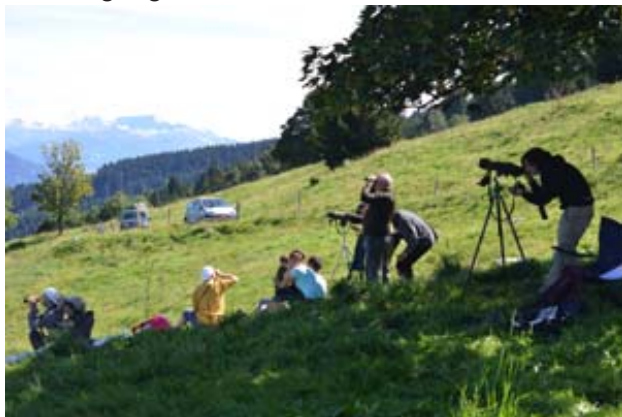
Beobachtungsposten auf der Vilterser Alp

Besonders auffällig ist der Vogelzug am Schollberg zwischen Sargans und Trübbach. Als sei er ein Leuchtturm für die südwärts ziehenden Vögel, können dort je nach Wetterlage grössere Ansammlungen von südwärts ziehenden Greifvögeln festgestellt werden. So wurden an einem Oktobertag innert 45 Minuten über Hundert vorbeiziehende Greifvögel gezählt.