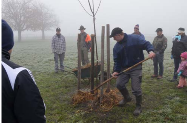
„So werden die jungen Hochstämme richtig gepflanzt“

Als Folgeveranstaltung zur Pflanzaktion organisiert BirdLife Sarganserland zusammen mit der Zentralstelle für Obstbau des Kantons St. Gallen einen Schnittkurs. Die Daten werden noch offiziell bekannt gegeben.