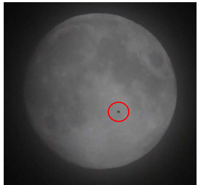
Ein Vogel „durchfliegt“ die Mondscheibe über Sargans in Richtung Südwest