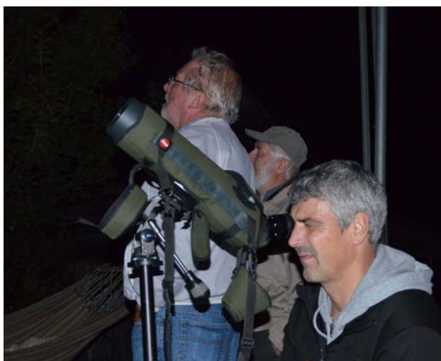
Nacht-Beobachtung bei Vollmond

Seit 2008 wird der herbstliche Vogelzug durchs obere Sarganserland untersucht. Mit dem Ziel mehr über die ziehenden Vogelarten und deren Zugwege zu erfahren, haben die beiden Vereine BirdLife und Natur Sarganser Land auch in diesem Jahr zwischen August und Oktober an unterschiedlichen Beobachtungsposten das Zugeschehen erfasst.