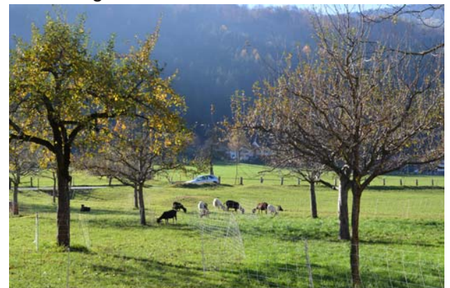
Junge Hochstammobstbäume in Flums

Unterstützt wurde der Verein durch die Gemeinden sowie dem kantonalen Amt für Natur, Jagd und Fischerei.